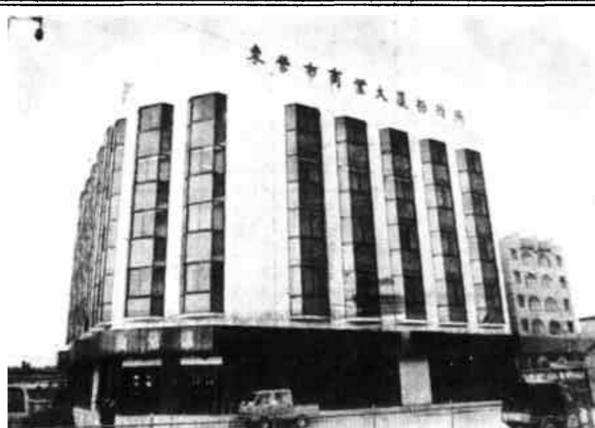
商业大厦招待所可同时接待120人住宿用餐,有容纳120人的会议室和200平方米的展销大厅。