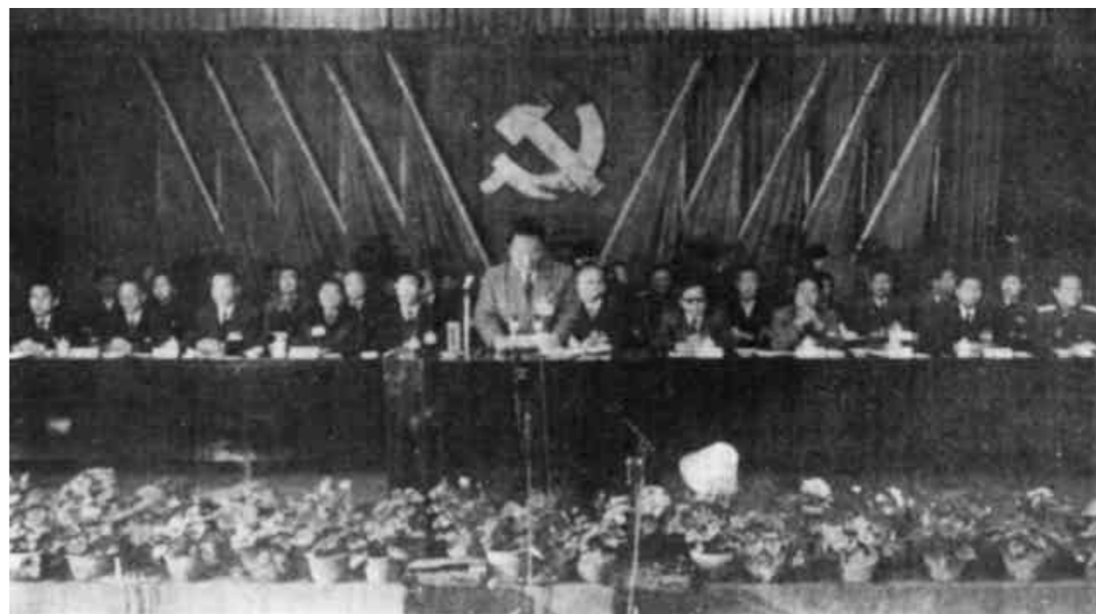
图为市第一次党代会大会主席台。