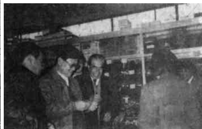
省长赵志浩(左二)来大厦视察