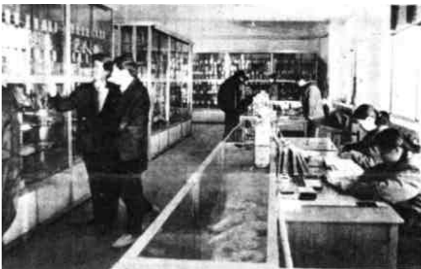
商业大厦股份有限公司直属的二级批发站营业厅